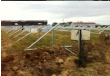
Bau von diversen Freilandanlagen im Megawattbereich