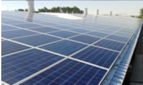
Bau von mehreren Solardachanlagen